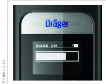
Símbolo "Prueba en curso"