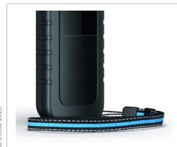
Juego opcional de láminas reflectoras (amarillas o naranjas)