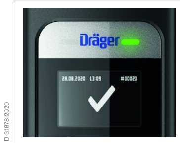
Símbolo "Alcohol no detectado"